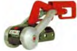
| Boîte d'attache AK